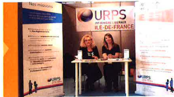
Le stand de l'URPS au salon infirmier

Ce colloque, organisé par Horizon et Santé le 16 octobre 2013, avait pour objet de plaider en faveur d'états généraux sur la douleur.